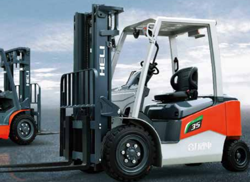
Električni viljuškari sa litijumskom baterijom